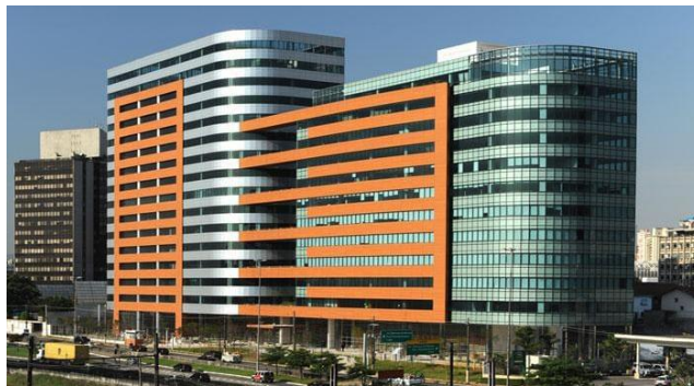
Figura 4: Fachada principal do empreendimento W Torre Nações Unidas

O empreendimento Torre Nações Unidas (figura 4), projetada pelo escritório Edo Rocha Arquitetura possui certificação LEED prata e teve como foco em sua concepção um direcionamento sustentável aos fatores energéticos e hidráulicos, reunindo uma série de atributos que contribuíram para o reconhecimento internacional dados pela certificação LEED concedida pelo USGBC e pelo Prêmio Master Imobiliário 2008 para Soluções de Arquitetura em Design Corporativo.