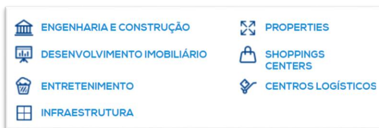
Figura 5: Áreas de Construção empreendedora WTorre

Segundo Edo Rocha (2018), a busca pela alta performance foi o ponto focal para as soluções de partido arquitetônico utilizados pelo arquiteto, seu objetivo era conseguir bons resultados em diversas vertentes: social, ambiental, econômica, urbana, sustentável, estrutural, estética, entre outros. Em uma primeira etapa foram construídas as duas torres, com 14 e 11 andares, e a terceira, com 16 andares ficou pronta em uma etapa posterior. O conjunto possui quatro andares de subsolo e cada lâmina conta com um núcleo de circulação central e serviços.