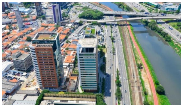
Figura 1: Contexto Edificação W Torre Nações Unidas

Dessa forma, observa-se o empreendimento W Torre Nações Unidas como exemplo de arquitetura que buscou ser sustentável desde o início de sua concepção, e segundo Edo Rocha (2018), “WT Nações Unidas é um conjunto de 3 edifícios que reúnem o estado da arte em termos de concepção arquitetônica integrada à tecnologia e ao meio ambiente”, sempre busca introduzir a arquitetura no contexto espacial e temporal onde está inserida (figura 1).