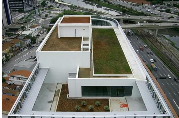
Figura 7: Cobertura verde do empreendimento W Torre Nações Unidas

Segundo a GBC Brasil (2017), entre os itens principais que garantiram a certificação sustentável, destaca-se a cobertura verde (figura 7), que reduz ilhas de calor em grandes centros urbanos, funcionando como uma alternativa de responsabilidade ambiental, ao melhorar a temperatura do ambiente e proporcionar um ambiente mais fresco no interior da edificação.