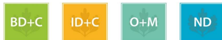
Figura 3: Níveis de Certificações do Sistema LEED

Dentre as certificações LEED existem quatro tipologias de projeto, conforme figura 3. A primeira é a LEED BD+C (Building Design and Construction) que fornece parâmetros para projetos e construção de edifícios novos; a segunda é a LEED ID+C (Interior Design and Construction), que possibilita a criação de ambientes internos sustentáveis; em seguida aparece a categoria LEED O+M (Building Operations and Maintenance), que dedica a atenção à operação e manutenção do edifício ao longo dos anos; e por último, a categoria LEED ND (Neighborhood Development), direcionada para projetos de desenvolvimento de bairros, em uma escala maior.