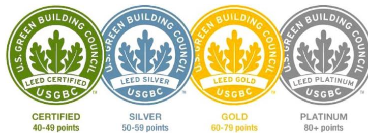
Figura 2: Níveis de Certificações do Sistema LEED

Segundo o Instituto GBC Brasil (2014) os edifícios são avaliados em sete tópicos antes de receberem as certificações. São eles: Espaço Sustentável (SS), Eficiência do Uso da Água (WE), Energia e Atmosfera (EA), Materiais e Recursos (MR), Qualidade Ambiental Interna (EQ), Inovação e Processos (IN), e Créditos de Prioridades Regionais (CR). Cada um desses itens tem um peso diferente nas diversas categorias de certificações, sendo que, quanto maior a pontuação, que varia de zero a cento e dez pontos, maior é o nível do selo conquistado (Figura 2), podendo ser Selo LEED (mais de quarenta pontos), Selo LEED Silver (mais de cinquenta pontos), Selo LEED Gold (mais de sessenta pontos) e Selo LEED Platinum (mais de oitenta pontos).