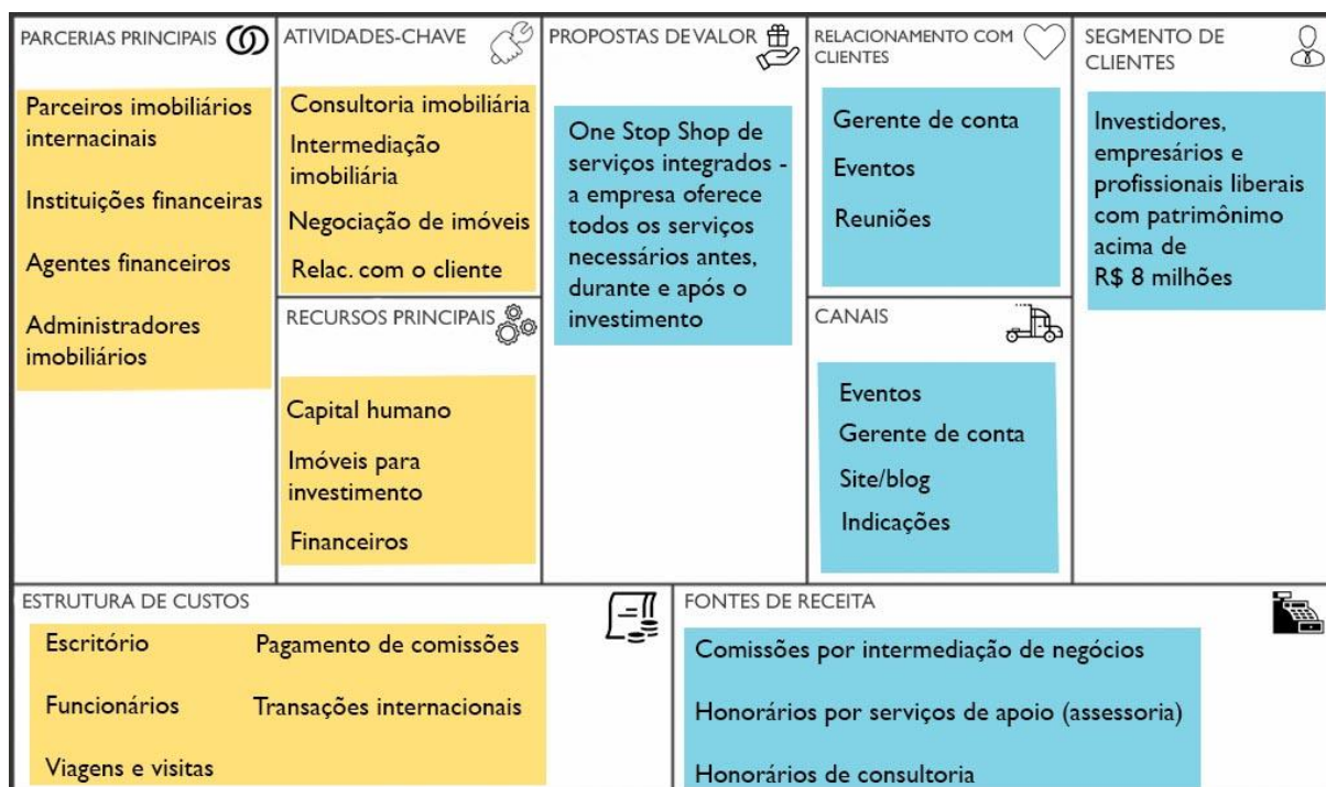
Figura 3. Quadro do modelo de negócios