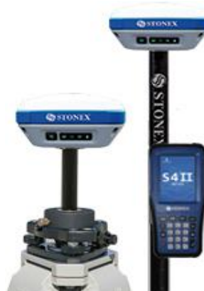
Figura 2 – GNSS topográfico Stonex S800

Por meio de estudos e de um minicurso sobre o modelo disponível, Stonex S800, foram levantados alguns de seus recursos e até realizados testes em diferentes regiões do Campus Higienópolis da UPM com o propósito de conhecer melhor essa tecnologia. Também foi feito um levantamento nos mesmos pontos coletados pela estação total e um pós-processamento de dados utilizando a RBMC.