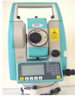
Figura 1 – Estação Total