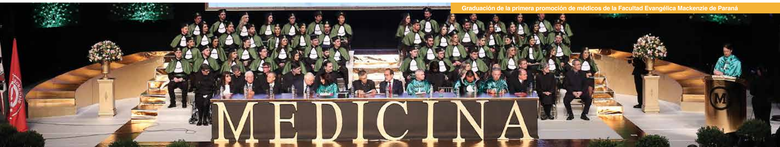
Graduación de la primera promoción de médicos de la Facultad Evangélica Mackenzie de Paraná

Por lo tanto, un código ético está, por su propia naturaleza, vinculado a los absolutos, a través de los cuales las actitudes y decisiones en su ámbito de aplicación deben ser evaluadas o juzgadas y, por lo tanto, consideradas dignas o reprobables.