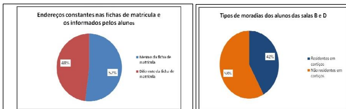
Figura 02: Fichas Cadastrais e Endereços reais.

cortiços ou moradias irregulares em um nicho mais específico da pesquisa que são os alunos de duas salas, a B e a D (fig 03).