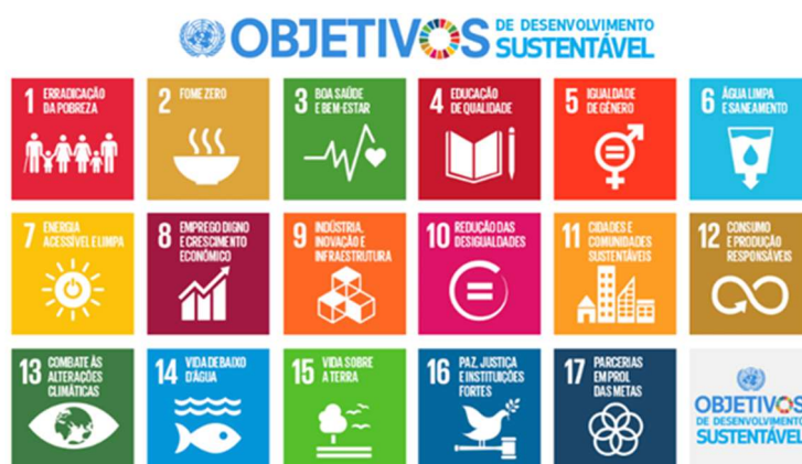
Figura 4: Objetivos de Desenvolvimento Sustentável das Organizações das Nações Unidas

O Projeto Cidades Inteligentes é dividido em duas fases. A primeira fase realizada com os alunos calouros dos cursos de Engenharia e Química permite que concomitantemente ao seu ingresso no Ensino Superior, que o discente tenha a oportunidade de estudar um problema real das cidades, vivenciando de imediato a realidade da profissão que está escolhendo. Nesta etapa, é desenvolvido o processo de ideação de uma proposta para solução de um problema das cidades amparado pelos Objetivos de Desenvolvimento Sustentável das Organizações das Nações Unidas (Figura 4).