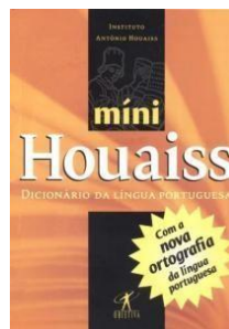
Houaiss Minidicionário Houaiss da Língua Portuguesa