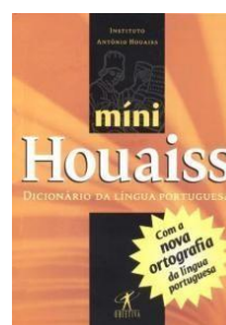
Houaiss Minidicionário Houaiss da Língua Portuguesa