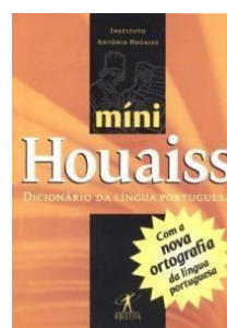
Houaiss Minidicionário Houaiss da Língua Portuguesa