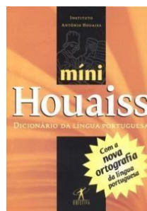
Houaiss Ed. Melhoramentos ou Minidicionário Houaiss da Língua Portuguesa Ed. Objetiva