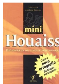
Houaiss Ed. Melhoramentos ou Minidicionário Houaiss da Língua Portuguesa Ed. Objetiva