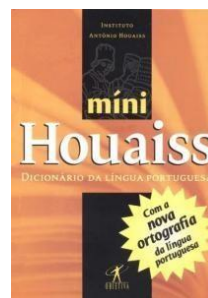
Houaiss Ed. Melhoramentos ou Minidicionário Houaiss da Língua Portuguesa Ed. Objetiva