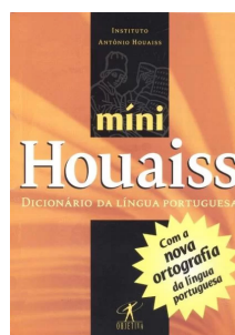
Houaiss Ed. Melhoramentos ou Minidicionário Houaiss da Língua Portuguesa, Ed. Objetiva