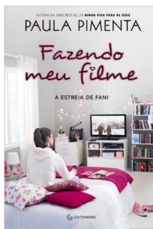
1º TÍTULO: FAZENDO MEU FILME AUTORA: PAULA PIMENTA EDITORA: GUTENBERG