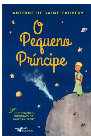
2º TÍTULO: O PEQUENO PRÍNCIPE AUTOR: ANTOINE DE SAINT-EXUPÉRY EDITORA: FARO EDITORIAL