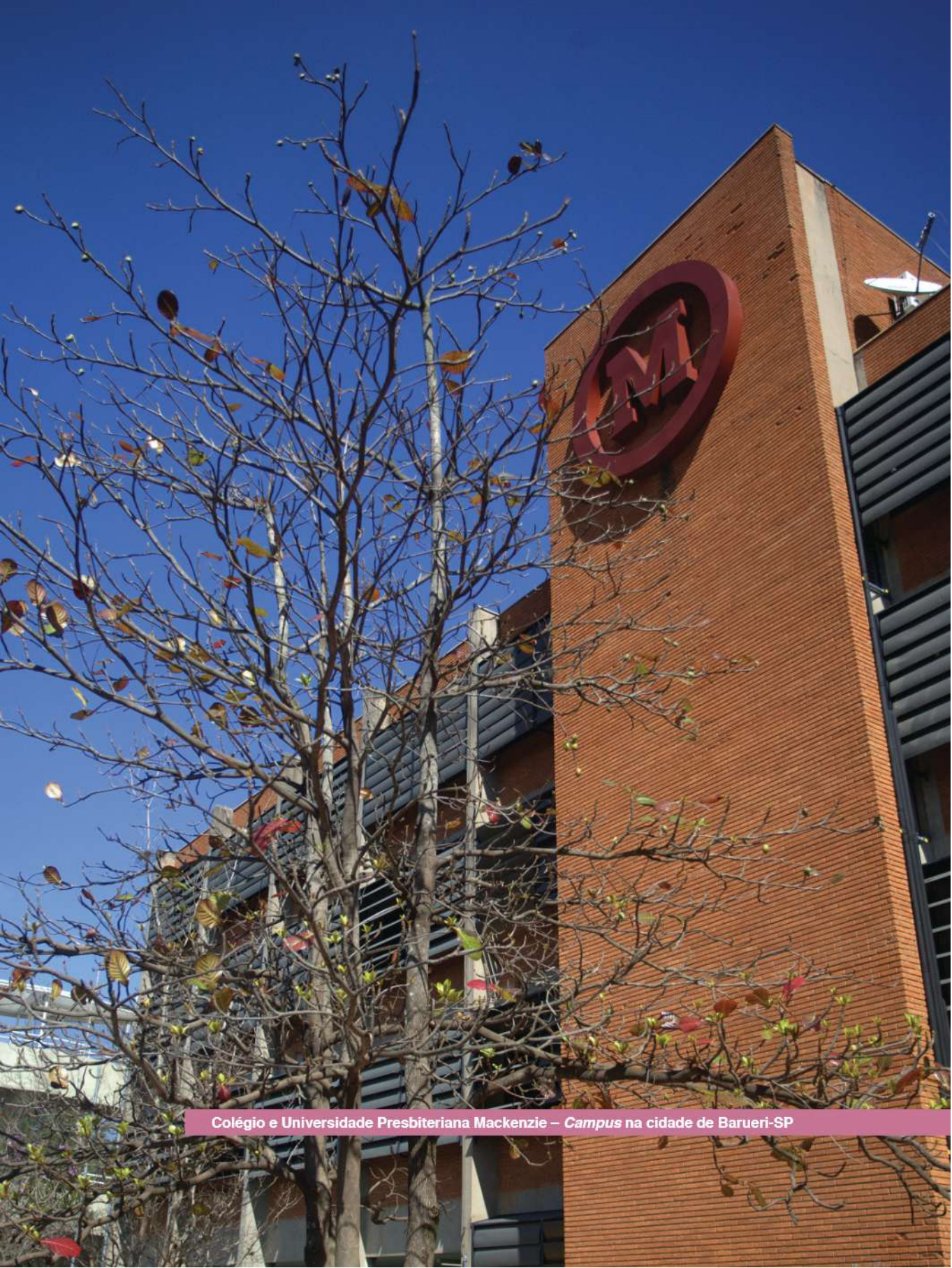
Colégio e Universidade Presbiteriana Mackenzie – Campus na cidade de Barueri-SP