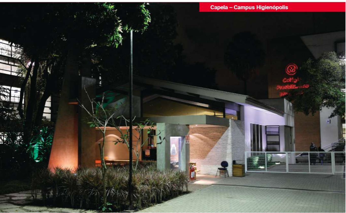
Capela – Campus Higienópolis

Para que cada colaborador tenha clareza sobre seu próprio papel no cumprimento dessa MISSÃO e o foco na VISÃO Institucional do Mackenzie, é essencial elucidar a acepção das expressões que compõem este Código de Ética.