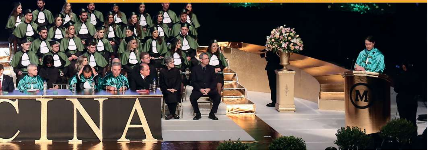
Formatura da primeira turma de Medicina da Faculdade Evangélica Mackenzie do Paraná

Portanto, um código de ética está, por sua própria natureza, vinculado a absolutos, por meio dos quais as atitudes e decisões em seu campo de aplicação, devem ser avaliadas ou julgadas e, assim, consideradas meritórias ou dignas de reprovação.