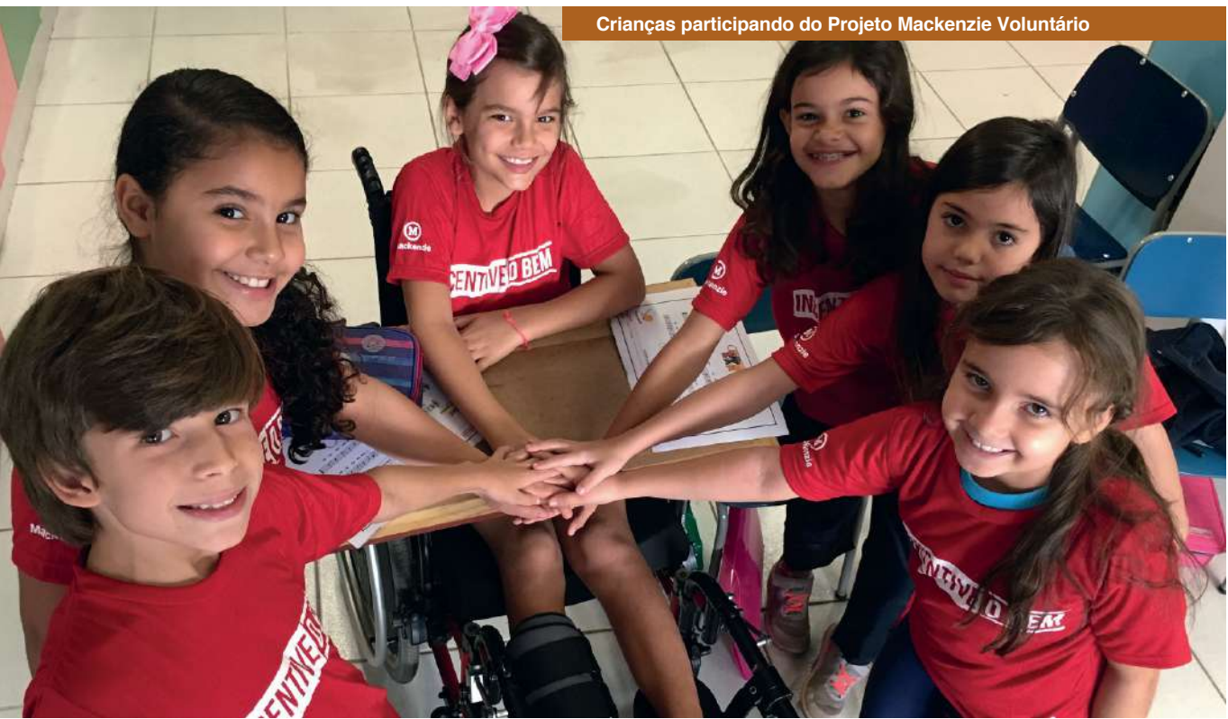
Crianças participando do Projeto Mackenzie Voluntário