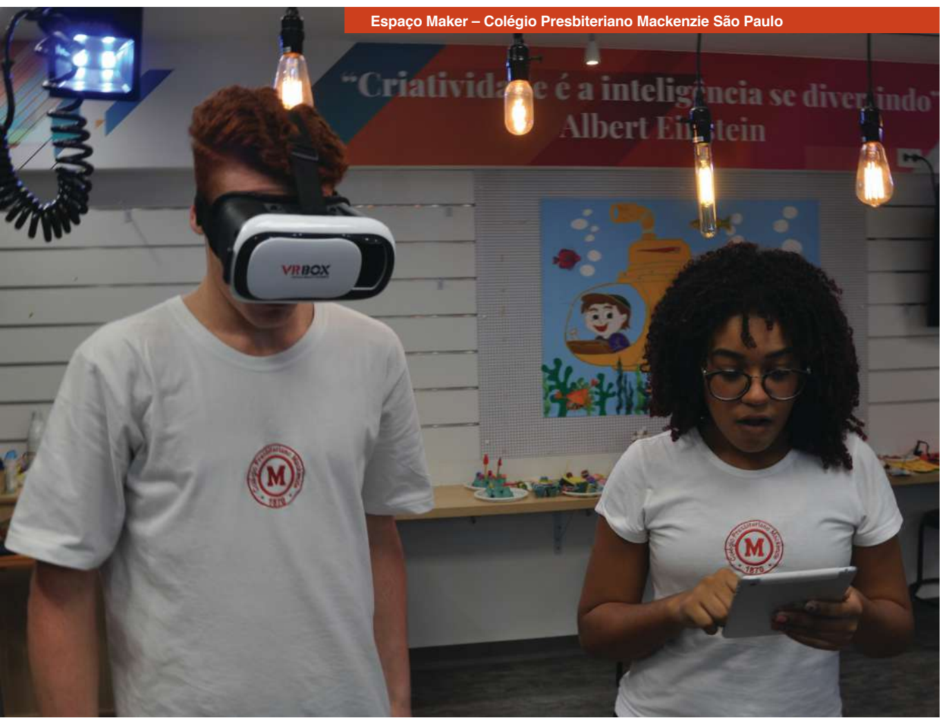
Espaço Maker – Colégio Presbiteriano Mackenzie São Paulo