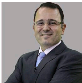
Juiz Fabiano Luzes