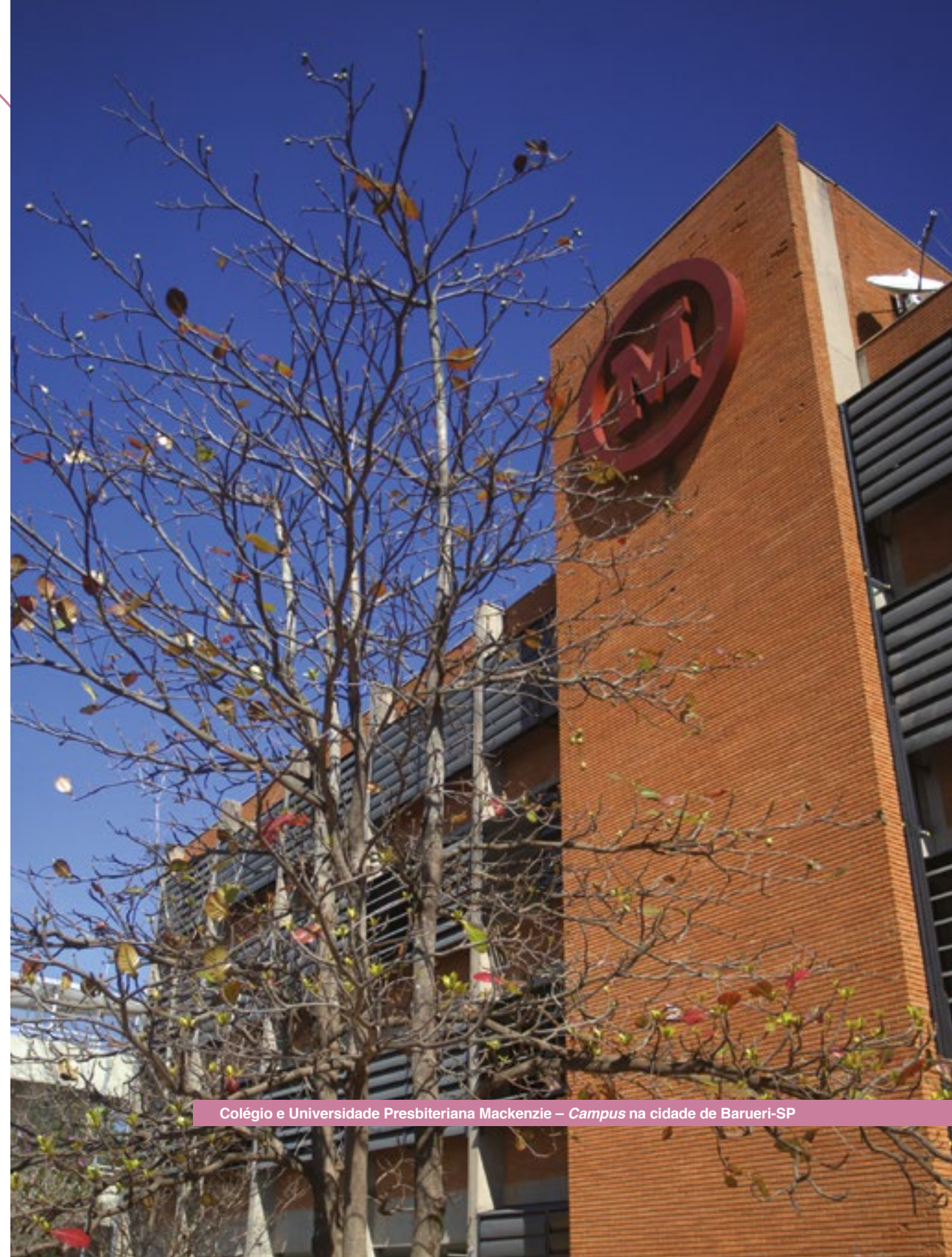
Colégio e Universidade Presbiteriana Mackenzie – Campus na cidade de Barueri-SP

O Regimento Interno do Código de Ética é a política responsável pela condução de situações de infração.