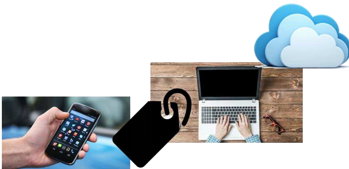
Figura 3. Ilustração da Solução Tecnológica para Manutenção Preventiva/ preditiva

A solução consiste em combinar essas três tecnologias existentes em um só produto, onde cada peça/componente é acompanhada por um chip, comercialmente conhecido por “tag” ou RFID, que carrega consigo informações importantes, tais como: data da última manutenção, nome do responsável pela última manutenção, descrição e código do produto, identificação do equipamento onde a peça ou componente se encontra e sugestão de data para manutenção preventiva/ preditiva.