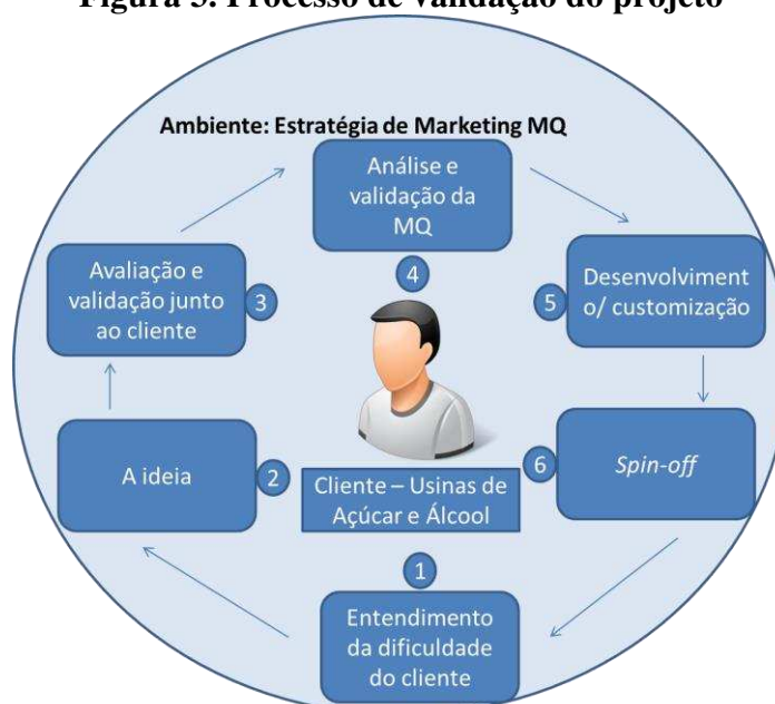
Figura 3. Processo de validação do projeto

Portanto, a oportunidade identificada carecia de um processo de validação interno e externo, que foi desenvolvido conforme apresentado na figura 3 a seguir.