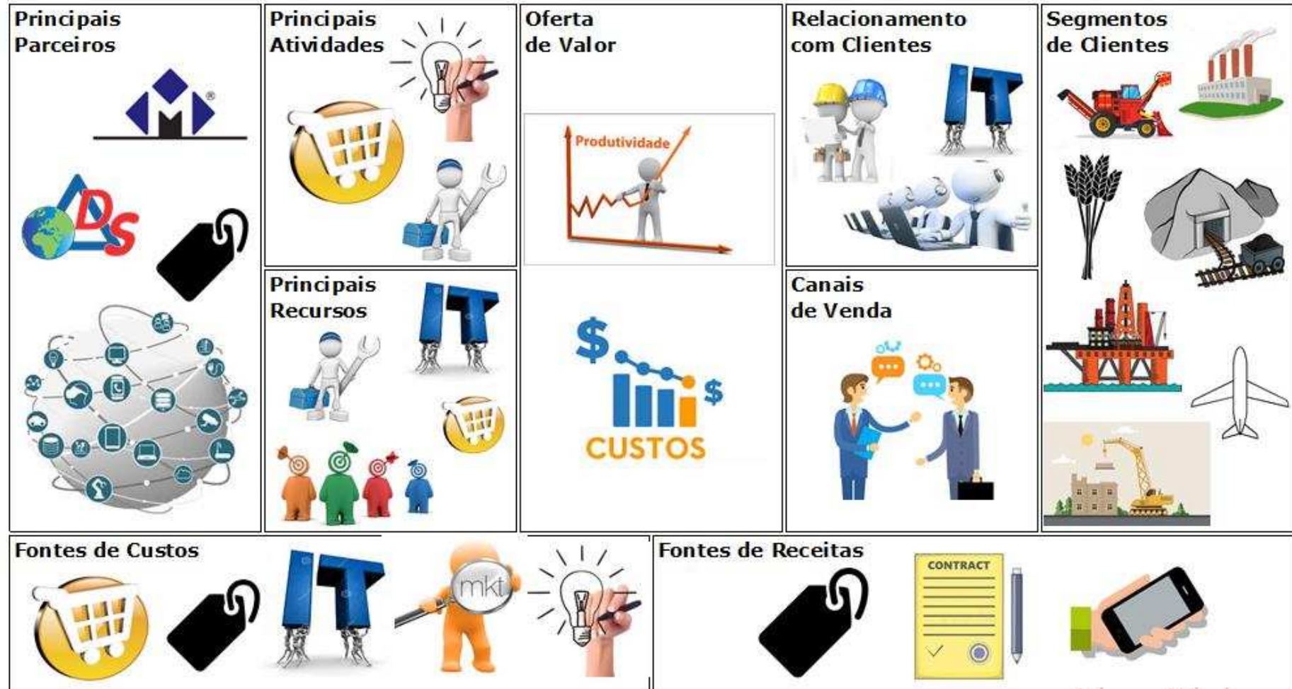
Figura 4. Quadro de Modelo de Negócios - Canvas da Spin-off