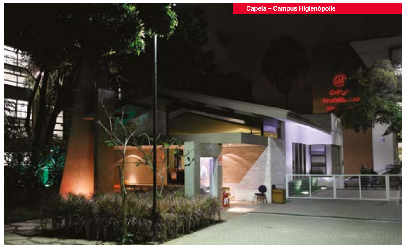
Capela – Campus Higienópolis

Para que cada colaborador tenha clareza sobre seu próprio papel no cumprimento dessa MISSÃO e o foco na VISÃO Institucional do Mackenzie, é essencial elucidar a acepção das expressões que compõem este Código de Ética.