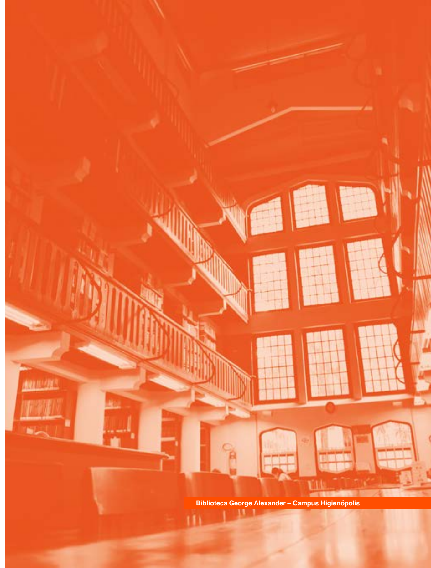
Biblioteca George Alexander – Campus Higienópolis