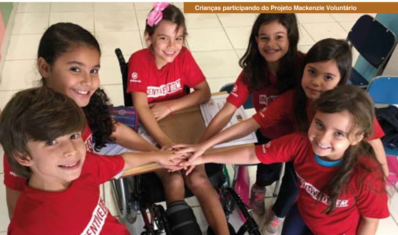
Crianças participando do Projeto Mackenzie Voluntário