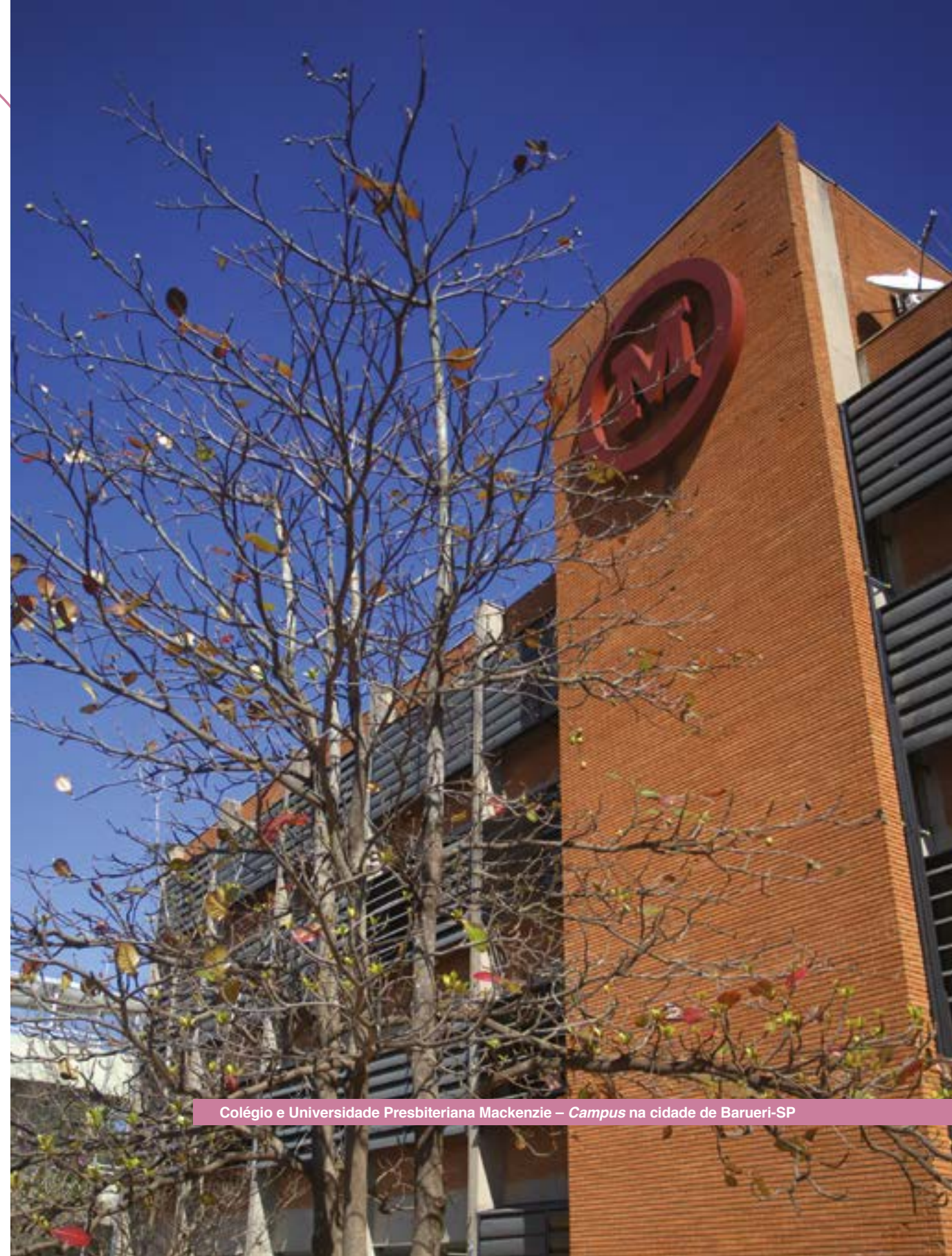
Colégio e Universidade Presbiteriana Mackenzie – Campus na cidade de Barueri-SP

O Regimento Interno do Código de Ética é a política responsável pela condução de situações de infração.